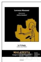
Malatesta. Indagini di uno sbirro anarchico