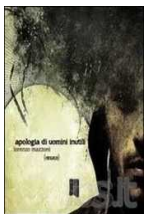
Apologia di uomini inutili