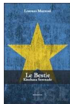
Le bestie. Kinshasa serenade