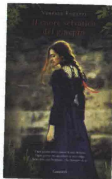
IL CUORE SELVATICO DEL GINEPRO Vanessa Roggeri, Garzanti, pag. 207, € 14,90

Il bellissimo Binyavanga Wainaina è uno dei più influenti intellettuali africani contemporanei. Questo è un romanzo di formazione che attraversa la vita di un uomo, dagli anni in cui giocava a calcio in porta con i fratelli, fino a quando diventa giornalista sportivo. Ma è anche la storia di un continente nuovo, sconosciuto sia ai media che alla letteratura contemporanea. Dal 1978 ai giorni nostri racconta il Kenya, il suo Paese, l'Uganda, la terra di nascita della madre, il Sudafrica caotico del post-apartheid, il Togo dei Mondiali di calcio, la Nigeria elegante e disperata. Standing ovation al traduttore Giovanni Garbellini.