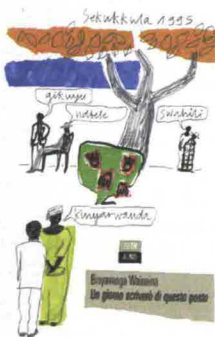
UN GIORNO SCRIVERÒ DI QUESTO POSTO B. Wainaina, 66thand2nd, pag. 290, € 18