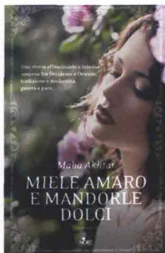
MIELE AMARO E MANDORLE DOLCI Maha Akhtar, Editrice Nord, pag. 451, € 15

DALLA SARDEGNA ALL'AFRICA, DAL LIBANO ALLA GERMANIA EST: QUATTRO STORIE CHE RACCONTANO