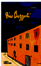
LA NERA DI DINO BUZZATI (A CURA DI LORENZO VIGANO), MONDADORI, 30 EURO

Dallo schianto della squadra del Torino sulla collina di Superga al crollo della diga del Vajont, fino alla strage compiuta da Rina Fort, la criminale che uccise la moglie dell'amante e i loro figli. Un volume straordinario che attraversa più di quarant'anni di storia italiana, quelli in cui Dino Buzzati ha lavorato come cronista di nera per il Corriere della Sera e il Corriere d'informazione . Delitti da prima pagina e disastri che ci mostrano come ogni storia possa diventare un grande racconto, svelandoci le pieghe del male e anche, talvolta, la sua redenzione.