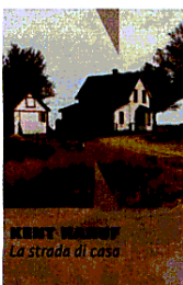
LA STRADA DI CASA DI KENT HARUF, NN EDITORE, 18 EURO

Jack Burdette torna nella sua casa di Holt dopo essere sparito per anni. Il suo arrivo è spettacolare, al volante di una Cadillac rossa. A parlarci di lui, con un lungo flashback sulla sua vita, è Pat Arburckle, direttore del giornale della città. Jack, che da giovane è un maschio tenebroso che riesce a conquistare la bellissima Wanda, desiderata da tutti. Wanda, che subirà le sue sbronze e lo servirà come un re finché lui le spezzerà il cuore sposando Jessie, abbandonata poi insieme ai figli. Il finale, che sa di riscatto, ci fa comprendere la straordinaria forza femminile.