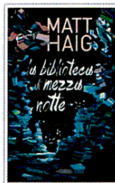
LA BIBLIOTECA DI MEZZANOTTE DI MATT HAIG, EDIZIONI E/O, 18 EURO

Nora Seed entra in contatto con i libri della Biblioteca di mezzanotte , volumi che hanno il potere di mostrarle come sarebbe stata la sua vita se avesse preso decisioni diverse. E così pensa di poter rimediare agli errori commessi che le hanno portato solo infelicità. Mentre sfoglia tantissimi libri alla ricerca di una versione alternativa della sua vita per costruirsi una perfetta, scopre però che in ogni esistenza c'è sempre una controparte oscura: possiamo solo vivere al meglio quella che abbiamo. Senza rimpianti.