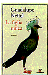
LA FIGLIA UNICA DI GUADALUPE NETTEL, LA NUOVA FRONTIERA, 16,90 EURO

Laura pensa che avere figli le tolga la possibilità di disporre del suo tempo e nella sua vita ha sempre avuto un'amica, Alina, con cui condividere questa scelta. Quando Alina, però, confessa di volere dei bambini dal compagno Aurelio e poi, una volta rimasta incinta, avrà dei problemi, Laura inizia a provare un fortissimo senso di protezione nei confronti della bimba non ancora nata. Non solo, sviluppa una grande dedizione verso tutti i bambini che man mano troverà sul proprio cammino. Una storia per tutte le donne, madri oppure no.