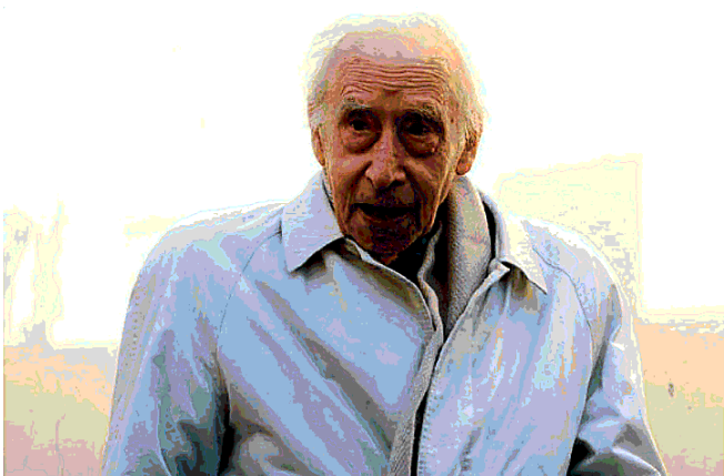
Mario Luzi, nato a Sesto Fiorentino il 20 ottobre 1914, è morto a Firenze il 28 febbraio 2005