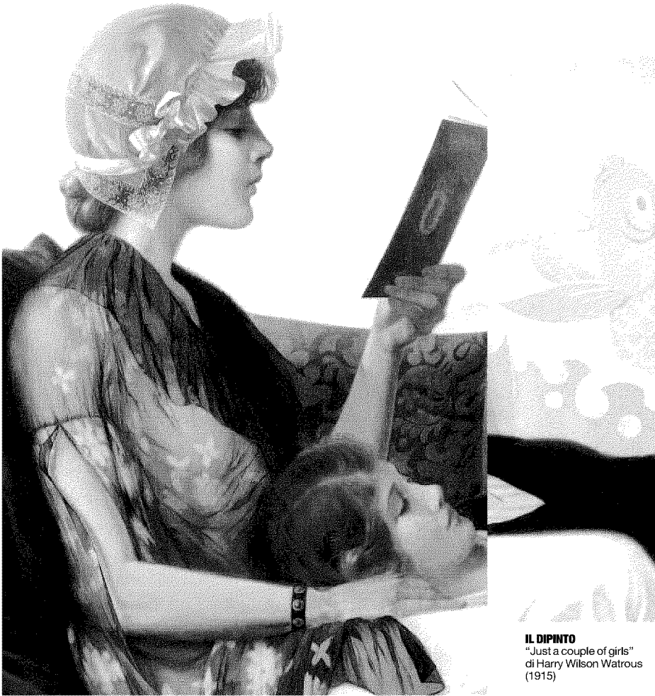
IL DIPINTO "Just a couple of girls" di Harry Wilson Watrous (1915)