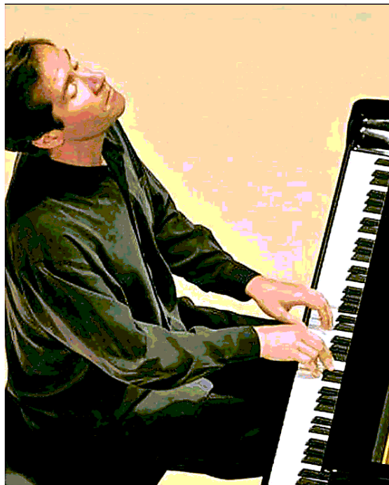
▲ Il pianista Nikolaj Lugansky in concerto al Palazzo dei Congressi di Stresa, ore 20.30, tel.0323.31095

Una domenica all'aria aperta, degustando quattro esecuzioni musicali del compositore -ornitologo Olivier Messiaen all'insegna del connubio tra suono e natura. Quest'anno le "Settimane Musicali di Ascona" mettono a segno un significativo appuntamento, affidandolo al pianista francese Pierre-Laurent Aimard che di Messiaen fu allievo e seguace. In programma il Catalogue d'oiseaux ispirato a canti e movimenti di 77 tipi di uccelli che sorvolano le regioni francesi. Si incomincia alle 7 al Lido di Ascona, per proseguire alle 11.30 al Monte Verità e nell'ora del tramonto (alle 17) davanti alla Chiesa di san Martino di Ronco. Infine, chiusura sotto il cielo stellato alle 22, davanti alla Chiesa del Collegio Papio. - ldf