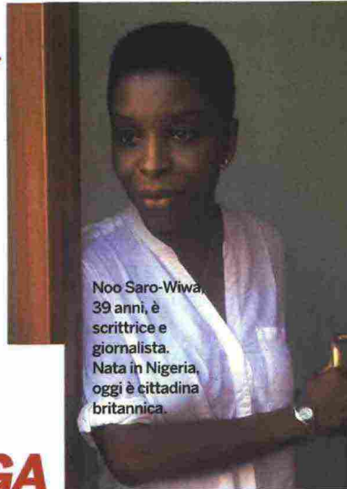
Noo Saro-Wiwa, 39 anni, è scrittrice e giornalista. Nata in Nigeria, oggi è cittadina britannica.

In cerca di Transwonderland, di Noo Saro-Wiwa, 66thand2nd, pp. 330, € 18.