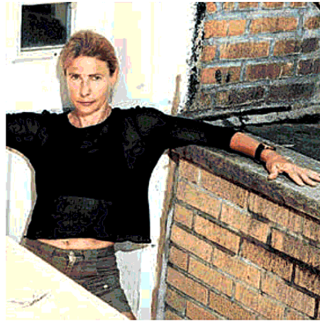
La scrittrice statunitense Lionel Shriver

le e quali conseguenze ciò potrebbe avere su quello che è stato fin qui descritto come il loro «dominio» sul mondo. Dall'altro, immaginare quali conseguenze potrebbe avere la disintegrazione di un intero sistema economico su diverse generazioni di una medesima famiglia ricca. I Mandible sono infatti più che benestanti, e del resto, descrivere l'impoverimento di una famiglia già povera non avrebbe avuto molto senso.