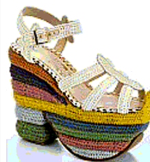
Ferragamo, Rainbow Future, 2018

Ruoterà attorno al tema della sostenibilità ambientale Sustainable Thinking la nuova mostra in programma da 12 aprile all'8 marzo 2020 al Museo Salvatore Ferragamo di Firenze. Argomento tra i più sentiti nei settori dell'arte e della moda, quello della sostenibilità è da sempre vivo nel dna della maison fondata da Salvatore che per primo, nel periodo dell'autarchia, sperimentò materiali poveri e di riciclo (dal nylon al celofane e dalla pelle di pesce al sughero e alla rafia) per dar vita a creazioni bellissime. Partendo da questo patrimonio di materie e forme il progetto espositivo firmato dalla direttrice del museo e della Fondazione Ferragamo Stefania Ricci racconterà quindi a tutto campo l'impegno per l'ambiente e l'attenzione alla natura grazie ai linguaggi speculari della moda e dell'arte che ad ogni rassegna del museo fiorentino vengono abbinati e fatti parlare all'interno