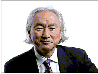
Michio Kaku è professore di fisica teorica a New York e conduttore di due seguitissime trasmissioni radiofoniche

Giusto per fare un paio di esempi, Robert Goddard - fondatore della missilistica moderna - fu apostrofato come folle dal New York Times e dalla comunità scientifica di allora (gli anni Venti) perché era insensibile e impossibile che i missili viaggiassero poiché nello spazio non c'era aria contro la quale spingere. Come disse una volta Sir William Osler, "... le filosofie di un'epoca sono diventate le assurdità dell'epoca successiva, e le sciocchezze di ieri sono diventate la saggezza di domani". Basti pensare che un'intera branca della fisica, la termodinamica (che contri-