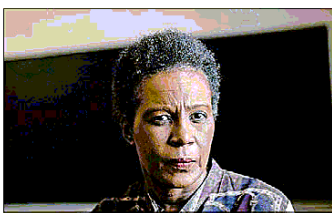
Claudia Rankine è rettore dell'Accademia dei poeti americani. Insegna inglese all'University of Southern California

Il volume indaga le varie forme in cui il razzismo è ancora radicato nella società e nella cultura statunitensi, costrin-