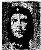
che guevara, il rugby

Q uando ancora non era il Che, ma correva per il campo di gioco urlando: «Scansatevi, arriva il Furibondo Serna!», poi abbreviato in Fu-ser, uno dei suoi soprannomi da giovane. Prima che il furore politico