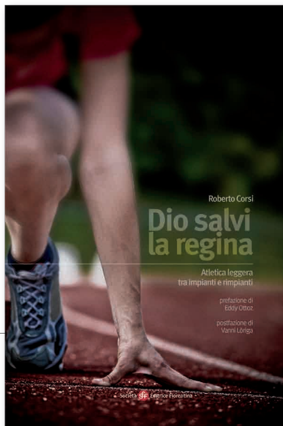
Roberto Corsi DIO SALVI LA REGINA Società Editrice Fiorentina pagine 224 (con foto in bianco e nero) 15 euro

Come scrive Eddy Ottoz nella prefazione: "Il percorso di Roberto disegna una ragnatela apparentemente casuale, per certi versi incoerente, forse incompleta, ma piacevolmente fresca e ingenua e, ciò che più conta, nuova. Fattore comune, collante del grande mosaico di questo libro è l'amore, il vero amore per l'atletica. Al giorno d'oggi, vi par poco?". Mentre Vanni Loriga nella postfazione chiosa: "Scorrendo le pagine dell'opera di Roberto Corsi mi pare di ruotare lentamente un caleidoscopio miracoloso: una dopo l'altra appaiono e riappaiono immagini talora reali, talaltra fantastiche se non quasi immaginarie. Mi trovo impegnato in un viaggio fra i più lontani dei miei ricordi con il pensiero che, ovviamente, all'incontrario va".