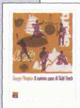
George Plimpton IL CURIOSO CASO DI SIDD FINCH 66thand2nd pagg. 320 17 euro

Da anni il reporter Robert Temple non riesce più a scrivere una riga. Si è rifugiato in un cottage per isolarsi dal mondo e allontanare i ricordi del Vietnam. Ma dalle sue parti, in Florida, c'è il ritiro dei New York Mets e Robert incontra per caso un giovane inglese, appena arrivato dalle montagne dell'Himalaya, che grazie all'autodisciplina del buddhismo e al controllo del proprio corpo riesce a lanciare la palla a una velocità impensabile. Il suo nome è Sidd Finch e il suo talento minaccia di sconvolgere l'equilibrio su cui si fonda il baseball. Il mondo dello sport è in subbuglio, i media si scatenano: che succederà quando il "cannone di Kathmandu" indosserà la divisa dei Mets? Ma Sidd non ha ancora deciso se diventare un atleta. Tra dibattiti surreali, spiegazioni paradossali di psicologi, biologi, storici e giornalisti e il coinvolgimento persino della mafia new-yorkese, Sidd viene travolto dagli eventi. Ingenuo e riservato, troverà nei silenzi di Robert e nell'amore di un'avvenente surfista le chiavi per comprendere l'America e decidere cosa fare della sua vita. Perché anche nel baseball il segreto del lancio perfetto sta nella mente e nel cuore del lanciatore.