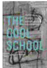
*libro in lingua originale

We often use words like "cool" and "hipster", we claim to have seen every episode of Californication, thinking we are up-to-date. But we wouldn't behave this way, had it not been for the incredible freshness and provocation of the poets, writers, musicians and outsiders of American culture in the 1950s and '60s. An anthology edited by the great Glenn O'Brien.