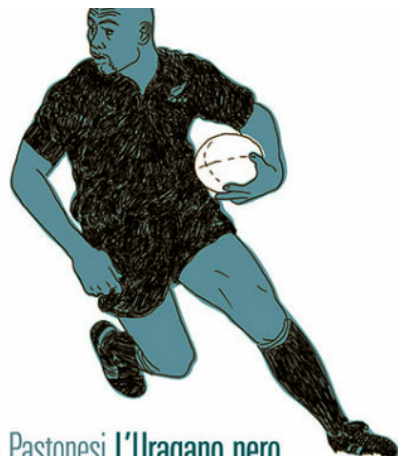
Marco Pastonesi L'Uragano nero Jonah Lomu, vita morte e mete di un All Black