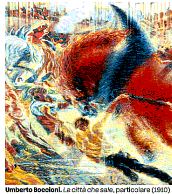
Umberto Boccioni. La città che sale, particolare (1910)

S tanotte mi sento vivo e capovolgerò il mondo. Fluttuo in estasi. Non fermatemi adesso": le parole di Freddie Mercury, scelte da Pascal Manoukian in Ciò che stringi nella mano destra ti appartiene (66thand2nd) sono il preludio di una storia dove la gioia si spegne improvvisa tra scie di sangue. La morte durante un attentato terrorista a Parigi cancella il sorriso di Charlotte e quell'amore che ha "come unica religione la felicità". Per il suo compagno Karim l'unica scelta per sopravvivere è cercare di capire l'origine di tanta violenza. Una lunga odissea lo porta sulle tracce dell'attentatore. Ad Aleppo il profumo degli aranceti in fiore non riesce a nascondere macerie fumanti, piante di bambini, follia di un fanatismo religioso che "nega, demolisce, cancella ogni traccia del passato". Un libro che trasforma la realtà in un viaggio senza ritorno, che indaga sulle cause e sulle scelte dell'Isis. Una consegna è affidata al lettore: conoscere il perché.