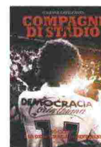
COMPAGNI DI STADIO Solange Cavalcante FANDANGO 318 pagine – € 18,50