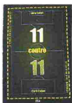
11 CONTRO 11 Luca Caioli - Cyril Collot ULTRA SPORT 184 pagine – € 14

zionale svelano i retroscena e i riti scaramantici che hanno accompagnato e scandito le partite più importanti dell'Italia nelle edizioni dei Mondiali. Molto tecnico è invece 2014 Fifa World Cup Brazil , il libro ufficiale della Coppa, una guida essenziale per chi vuole conoscere tutti i protagonisti in campo in Brasile, le statistiche