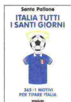
ITALIA TUTTI I SANTI GIORNI Santo Pallone KOWALSKI 128 pagine – € 8