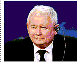
Eurocasta polacca Jaroslaw Kaczynski