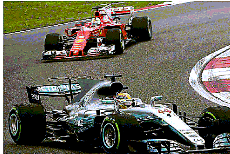
Shanghai: Lewis Hamilton (Mercedes) braccato dal ferrarista Sebastian Vettel

La gara ha avuto due momenti chiave. Il primo, dopo una partenza regolare, è stato l'ingresso della safety car a inizio quarto giro in seguito allo schianto di Antonio Giovinazzi nello stesso punto dove aveva picchiato ieri la sua Sauber, distruggendola. Auto costrette a passare sulla pit lane per far pulire la pista e Vettel, che aveva anticipato il cambio delle gomme intermedie, ha perso il suo vantaggio trovandosi imbottigliato nel traffico mentre Ha-