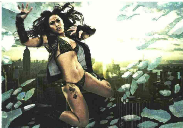
La reality star americana Hoopz