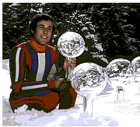
Gustav Thöni (Stelvio, 28 febbraio 1951)