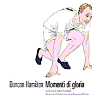
Duncan Hamilton Momenti di gloria

Figlio di un evangelizzatore trasferitosi in Cina, Liddell è stato senz'altro un predestinato della corsa, ma soprattutto un uomo di Chiesa dalla fede talmente granitica che alla domanda su come avesse fatto a ottenere quell'inattesa vittoria rispondeva: «Ho fatto i primi 200 più veloce che potevo. Poi gli altri 200 con l'aiuto di Dio». Confessione che racconta già molto di un uomo che alla fama sportiva, all'amore della famiglia e forse alla vita stessa antepose sempre i doveri di un missionario, adempiuti con uno stoicismo che non va-