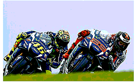
Un duello tra Valentino Rossi, 37 anni, e Jorge Lorenzo, 29

to hanno vinto 54 GP (13,5 l'anno), realizzato 64 pole (16 l'anno) e conquistato 105 podi (26,2 a stagione). Mostruosi anche i 2.529 punti raccolti in quest'arco di tempo, grazie a 3 annate al di sopra dei 700 punti: 701 nel 2014, 703 l'anno dopo e 765 quest'anno. Il loro margine era tale che in gara