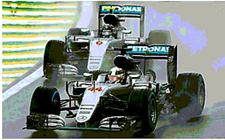
Lewis Hamilton, 31 anni, precede Nico Rosberg, 31 in Brasile

● Insieme Hamilton-Rosberg e Rossi-Lorenzo hanno regalato numeri straordinari a Mercedes e Yamaha