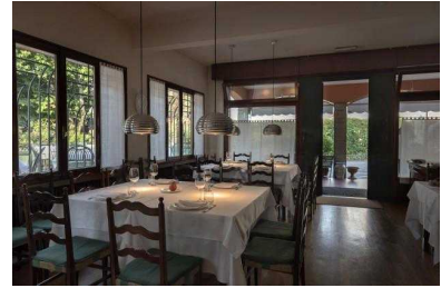
Ristoranti Bologna, trattoria Ai Canaletti di Budrio