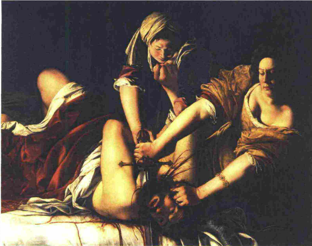
© Giuditta che decapita Oloferne, Artemisia Gentileschi, 1620 ca., Galleria degli Uffizi Firenze