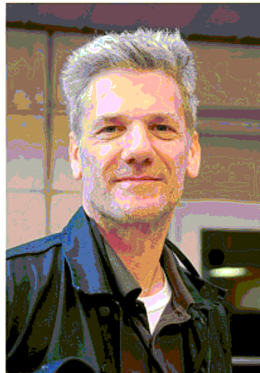
TRIOLOGIA Alan Pauls è nato a Buenos Aires nel 1959

Quando la Gran Signora sguainò il dito dalle mie labbra, disse, riferendosi al regime militare argentino, «ma la nostra milizia è più profonda». Alcune frasi di Pauls, stilette etiche («Il dolore è la sua educazione, e la sua fede»; «La felicità è l'inverso simile per eccellenza»; «Diffida della gioia come del resto di ogni emozione capace di dare, a chi vi è immerso, la sensazione di non aver bisogno di nulla»), mi ricordano quelle parole. Lo scrittore milita nell'illimito, nessun regime può sopprimerlo o salvarlo.