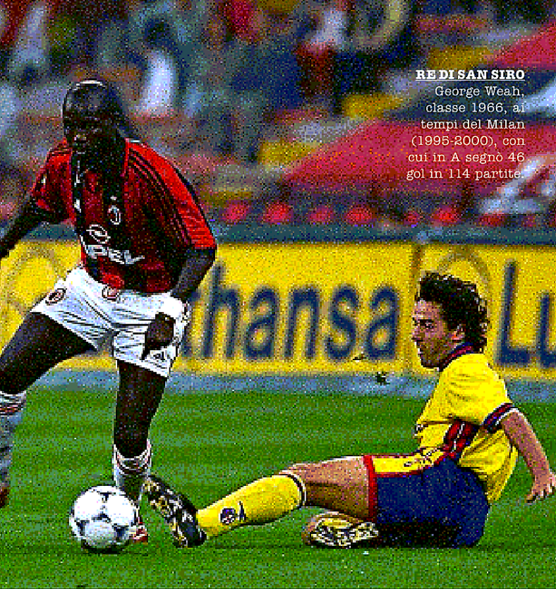
RE DI SAN SIRO George Weah, classe 1966, ai tempi del Milan (1995-2000), con cui in A segnò 46 gol in 114 partite.

Oggi capo politico della Liberia, Weah ha una storia personale e sportiva eccezionale. Dalla miseria al Pallone d'oro per diventare il "Re George" della Milano rossonera