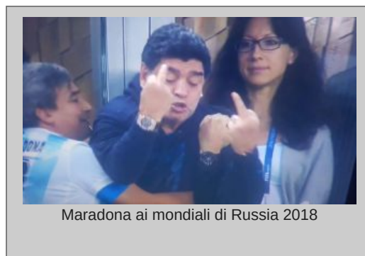
Maradona ai mondiali di Russia 2018

«Non sono d’accordo nel definirlo macchietta, è stata una apparizione Inca a San Pietroburgo, io l’ho raccontata così. Maradona è quella cosa là, non puoi andare al concerto dei Metallica e chiedere di abbassare il volume. Maradona viaggia su altre frequenze, non può essere assimilato a niente ».