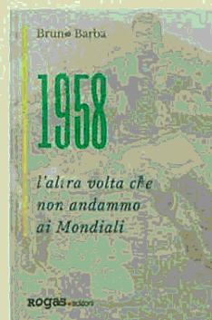
Bruno Barba, 1958, l'altra volta che non andammo ai Mondiali , Rogas ed. Pagg. 270, 19,90 €

Era il 1958 e la nazionale non arrivò alla fase finale dei Mondiali di Svezia. La vicenda offre all'antropologo Bruno Barba l'occasione per un affresco sul campionato e il calcio di allora, il trionfo del Brasile del 17enne Pelé, moda e cultura di un anno di fermento, saltando dalla ragnatela di Jašin all'uscita di Colazione da Tiffany , dalla Sanremo di Nel blu dipinto di blu all'inaugurazione dell'Autostrada del sole. Fa venir voglia di leggere cosa scriverà lo studioso che, tra 60 anni, guarderà all'Italia orfana del Mondiale 2018.