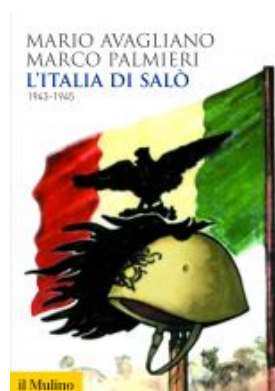
L'Italia di Salò. 1943-1945