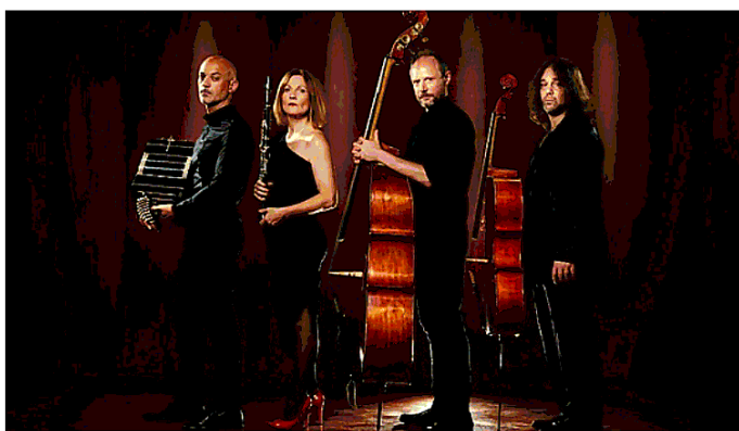
Il BossoConcept Ensemble, attivo dal 2001 nel panorama musicale nazionale e internazionale