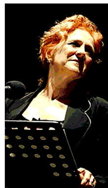
L'attrice Elisabetta Pozzi