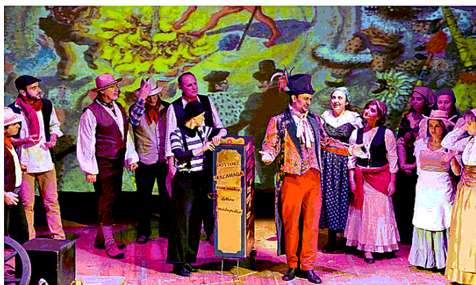
Sopra e sotto alcune scene dell'opera "Elisir d'amore" al Teatro Verdi di Fiorenzuola

Applausi decisi non solo a fine atto, ma anche nel cambio tra un quadro e l'altro e soprattutto per salutare l'esecuzione del brano più celebre dell'opera "Una furtiva lagrima", quella lagrima che rivela l'amore inconfessato (pure a se stessa) di Adina per il contadino Memorino. L'amore genuino alla fine trionferà, ma la sottolineatura della regia - nell'intera vicenda - è la difficoltà di esprimere quel sentimento: si adotta la metafora dello spaventapasseri che si erge nel campo arido della nostra anima. Altra efficace immagine evocativa scelta dalla regista è quella dell'apparizione di Dulcamara non accompagnato da un aiutante maschio, bensì da una giovane che richiama volutamente la Gelsomina felliniana de "La Strada".