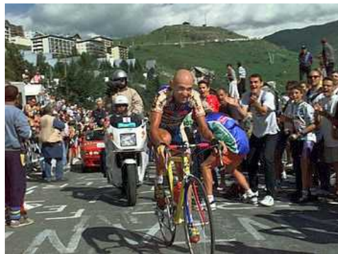
Marco Pantani al Tour del 1997, da: it.wikipedia.org .

Domani 14 febbraio è il decimo anniversario della tragica morte di Marco Pantani, il pirata di Cesenatico, grande campione del ciclismo su strada, indimenticabile per le sue imprese sulle salite più dure del Giro e del Tour, è stato un grande ciclista che ha fatto sognare milioni di persone appassionate di questo sport.