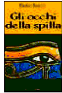
Gli occhi della spilla Enrico Sartori Piazza Editore 12 euro

Lei, che nel frattempo è diventata single, è attratta dall'antico Egitto e dai suoi misteri. Tra i due sarà un amore a prima vista che indurrà Frank a far di tutto per proteggere l'amata quando qualcuno tenterà di rapirla, e forse di