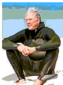
● Nella fotografia qui accanto il surfista e scrittore William Finnegan. A destra Fernando Aramburu e più in là Geoff Dyer

Ecco quindi che «Giorni selvaggi» diventa un'importante occasione di crescita, la possibilità di fare qualcosa insieme e in grande, che non relegerà gli scrittori nelle sale alliche di Palazzo Granieri, ma li porterà in giro per la città. Alcuni appuntamenti infatti saranno anticipati da un percorso di avvicinamento ai romanzi degli autori curati dai Gruppi di Lettura delle Biblioteche Civiche torinesi. Alcuni scrittori incontreranno gli studenti del network di biblioteche scolastiche Torino Rete Libri e nelle settimane precedenti gli incontri, il Salone e i tutor della Scuola Holden preparano gli alunni con tre incontri in classe: sa-