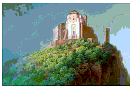
● Uno degli acquerelli di Giuseppe Pietro Bagetti conservati nell'appartamento del Re al piano terra. La visita (dalle 10 alle 12 e dalle 15 alle 17, con partenza ogni ora) è a cura degli Amici di Palazzo Reale

Venerdì 1 torna anche l'appuntamento con #realidiserà che offre la possibilità di ammirare, in orario serale (19,30 - 22,30) le collezioni dei Musei Reali e le mostre in corso al costo ridotto di 3 euro (con apertura della biglietteria alle 18,30 e diverse visite guidate, info su www.museireali.beniculturali.it ). Domenica 3 settembre infine l'ingresso ai Musei Reali sarà, come ogni prima domenica del mese, gratuito. Si tratta della «Domenica al museo», l'ormai tradizionale e consolidata iniziativa ministeriale. I Musei Reali