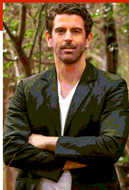
● A destra Richard Mason, che apre la rassegna; nelle foto a sinistra Coloson Whitehead e Elisabeth Strout

S e vuoi cavalcare le onde giuste, devi essere pronto a mollare tutto quel che stai facendo e a partire per andartele a prendere». Come i surfisti, saranno «Giorni selvaggi» quelli che il Circolo dei Lettori si appresta a vivere appena dopo la pausa estiva. E non solo perché arrivano dieci importanti scrittori internazionali, tra cui tre Premi Pulitzer (compreso quel William Finnegan che con il suo libro «Barbarian days», tradotto con selvaggi, ha dato il titolo alla rassegna), un National Book Award, un maestro dell'Europa orientale, un inglese supercult. Ma anche perché per la prima volta il progetto vede riuniti il Circolo di via Bogino 9, il Salone Internazionale del Libro, il Salone Off 365, le Biblioteche Civiche, la scuola Holden, le librerie indipendenti torinesi.