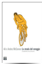
La strada del coraggio. Gino Bartali, eroe silenzioso