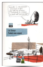
Prudenti come serpenti