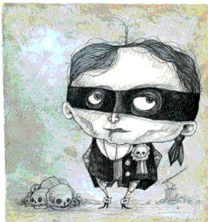
Memorie di un boia che amava i fiori, Bakemono Lab 2020