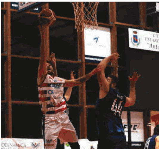
Borioni sotto canestro

Il successo sugli uomini di Massaro tiene i potentini sempre in testa alla classifica in coabitazione con Caiazzo e Parete e quindi ancora in lizza per il platonico titolo di campioni d'Inverno a 40' dal termine del girone d'andata, dopo aver conquistato già sette giorni fa la qualificazione