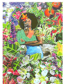
Sistema nervoso in costruzione Margo Jefferson 66thand2nd, pp. 176, 17 euro

TRADUZIONE MARGO JEFFERSON ISTEMA NERVOSO IN COSTRUZIONI