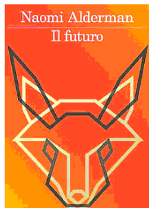
Il futuro Naomi Alderman Feltrinelli, pp. 448, 22 euro

Immagina che stia per arrivare la fine del mondo. Immagina che esista un algoritmo in grado di avvisarti con dieci giorni di anticipo e che solo un gruppo ristretto e molto selezionato di persone abbia accesso a queste informazioni. Salteresti a bordo di un aereo per salvarti mentre il resto dell'umanità collassa sotto la pressione del cambiamento climatico e di una nuova pandemia? Il nuovo romanzo distopico dell'inglese dopo "Ragazze elettriche".