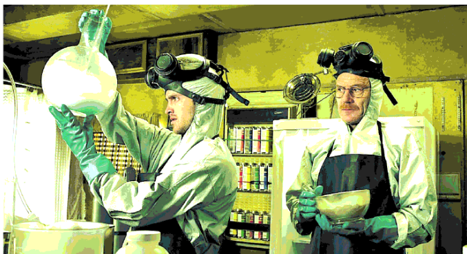
Una sequenza di Breaking Bad, una delle serie televisive più famose di tutti i tempi