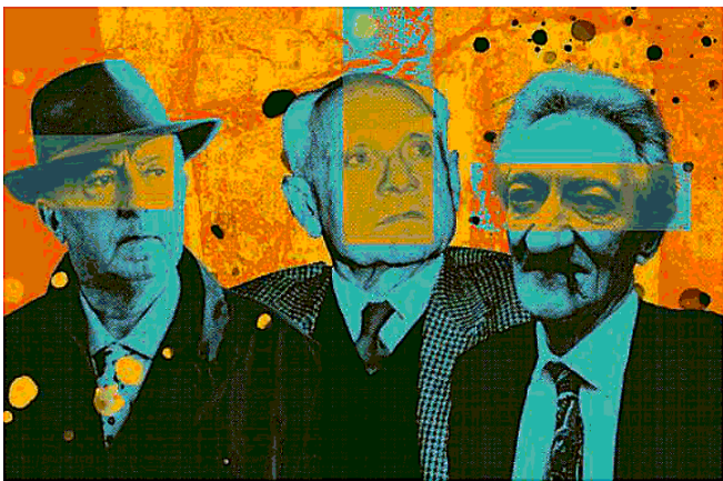
Ormai "I linguisti appaiono più autorevoli dei critici latitanti o ignorati" (grafica di Enrico Ciochetti)