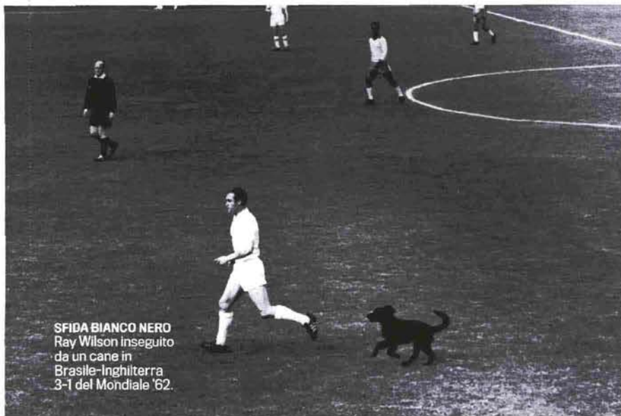
SFIDA BIANCO NERO Ray Wilson inseguito da un cane in Brasile-Inghilterra 3-1 del Mondiale '62.