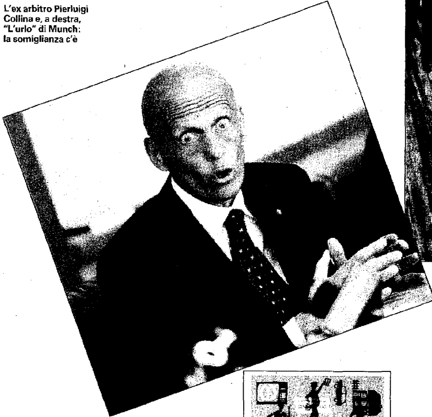
L'ex arbitro Pierluigi Collina e, a destra, "L'urlo" di Munch: la somiglianza c'è