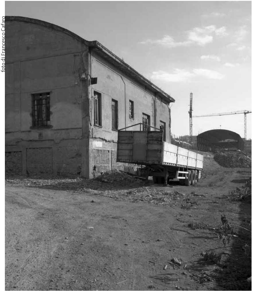
Tratto della zona della Vasca Navale adiacente alla Facoltà di Ingegneria

menti di Ingegneria e di Fisica. Va detto però che l'espandersi di "Roma Tre", oltre ad appoggiarsi su strutture preesistenti, ha determinato la costruzione di nuove strutture, non sempre in armonia con